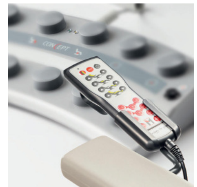
Hand- und Fußschalter